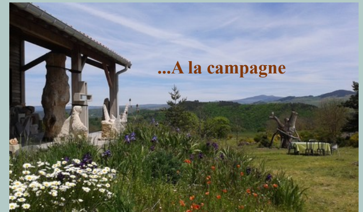
...A la campagne

Propose : des formations professionnelles, des stages, des cours L'atelier Pieris étudie toute demande d'ateliers à thèmes (enfants, adultes, publics spécifiques...), préparation aux écoles d'art.