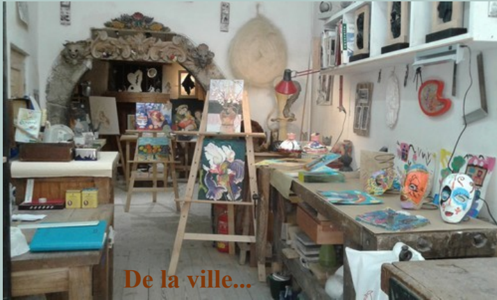
De la ville...